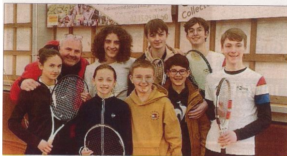
Après une prestation intense et solidaire face aux jeunes de Lillebonne, l'équipe sport études tennis du collège Bobée se qualifie pour la finale académique