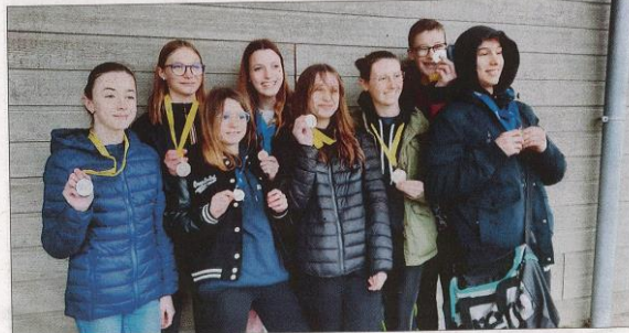
Très beaux résultats des nageurs du collège Bobée aux championnats académiques de natation qu'ils terminent à la seconde place