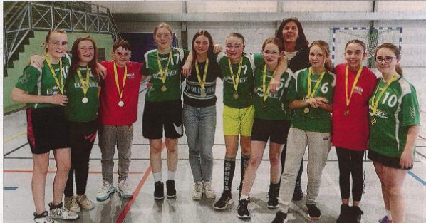
Belle prestation pour les jeunes basketteuses minimes du collège Bobée qui, après le titre départemental, remportent le titre académique

Souhaitons à cette jeune et belle équipe, motivée et soudée, de poursuivre l'aventure le plus loin possible.